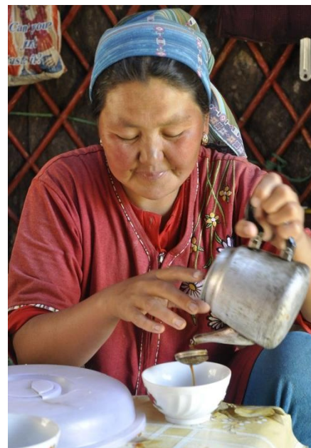
V kirgizskej jurte